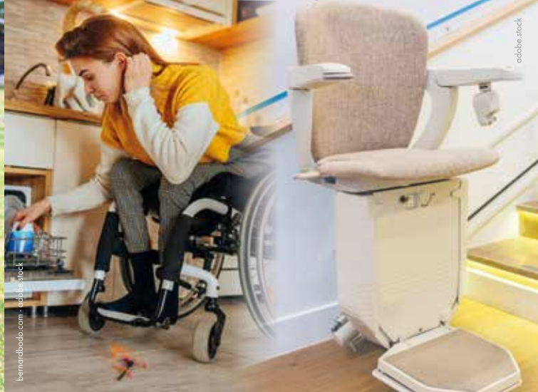
bernardbob.com - schubstock